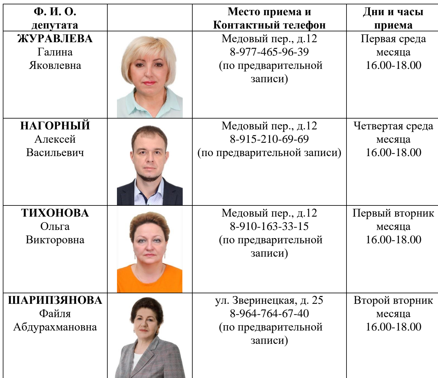
График приёма депутатов Совета депутатов муниципального округа Соколиная гора в городе Москве Избирательный округ №1

Приложение к решению Совета депутатов муниципального округа Соколиная гора от 06 декабря 2022 № 5/2